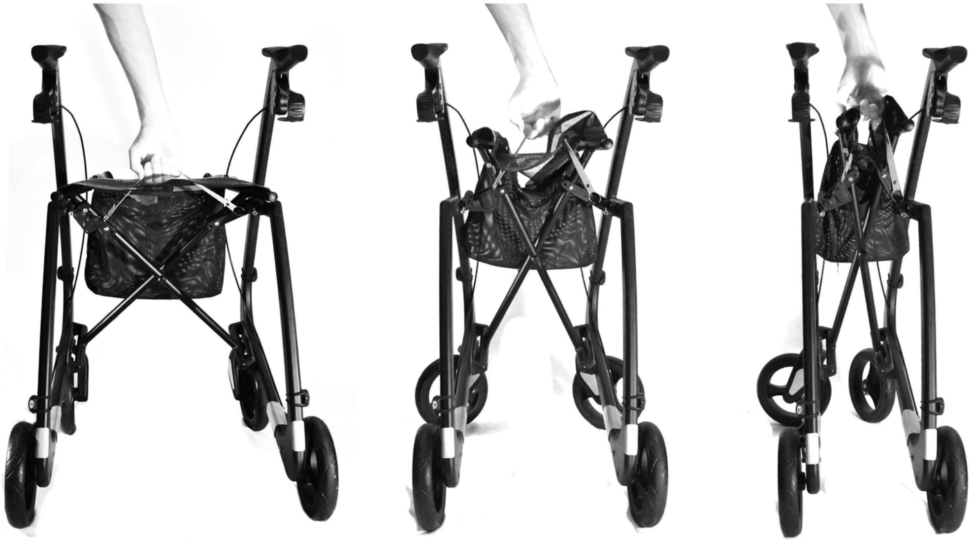
Klappmechanismus zur Benutzung im engen Raum